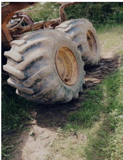
1. Traktor forwarder - stanje guma