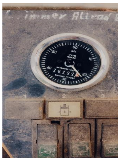
4. Traktor forwarder – sati rada