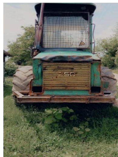
6. Traktor forwarder – oznaka na traktoru