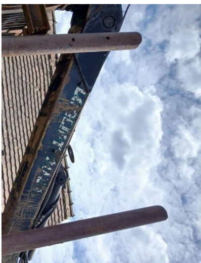
5. Traktor forwarder – oznaka na dizalici