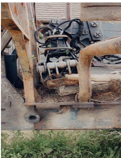
3. Traktor forwarder - prikolica