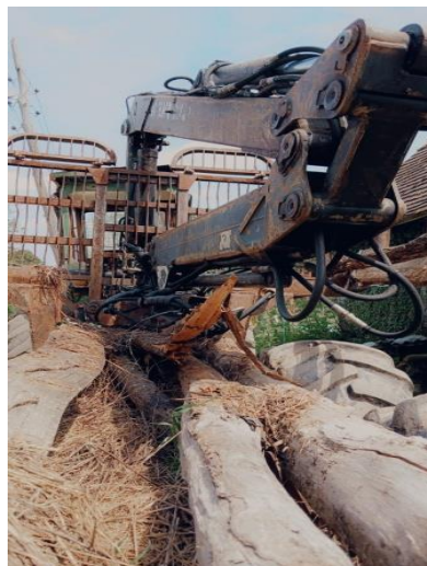
2. Traktor forwarder – utovarna sprava